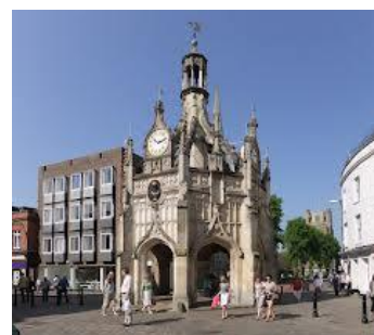
チチェスター・クロス