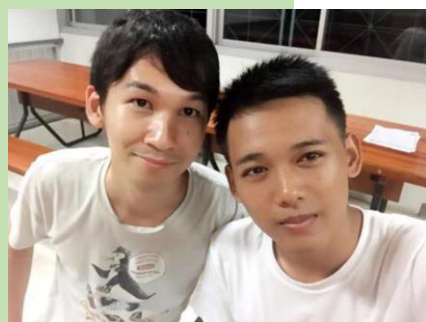
ダンスのリーダーとツーショット (左が長山さん)